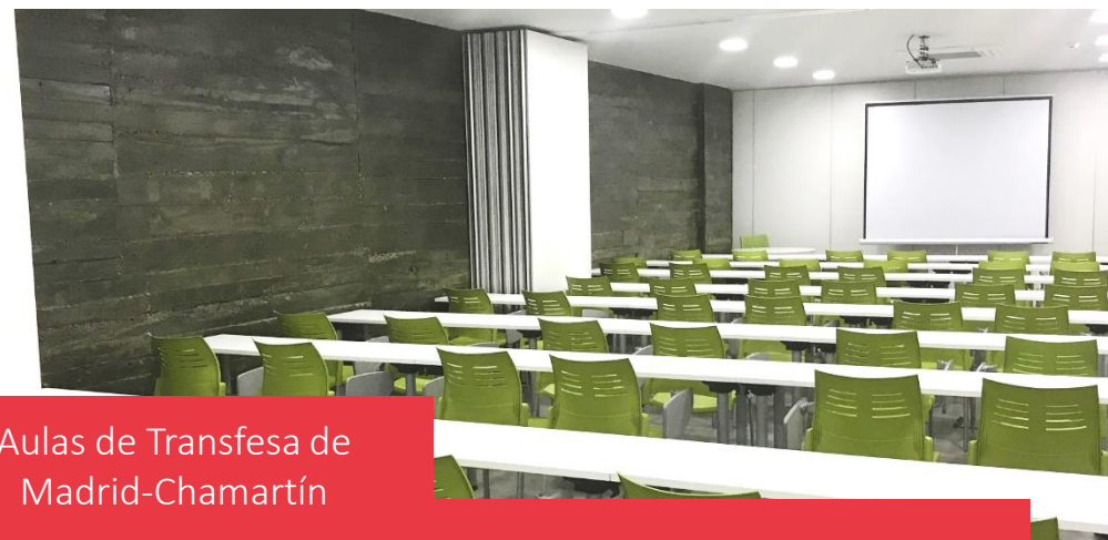
Aulas de Transfesa de Madrid-Chamartín

Aquellos alumnos que finalicen la formación teórica y práctica, después de completar un examen final de curso, serán presentados al examen oficial de la Agencia Estatal de Seguridad Ferroviaria (AESF) , quien otorgará a los alumnos la licencia y el diploma de maquinista.