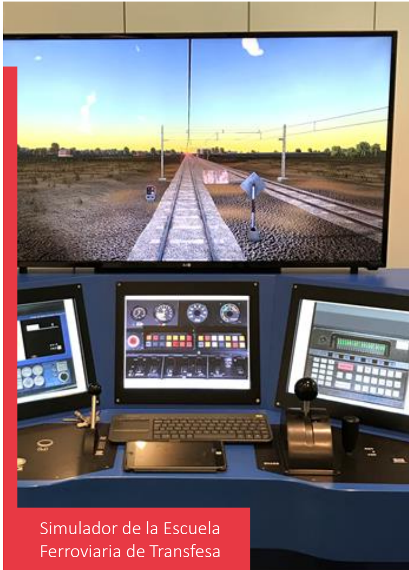
Simulador de la Escuela Ferroviaria de Transfesa

Según establece la Orden FOM 2872/2010, de 5 de noviembre, los alumnos deberán contar con: